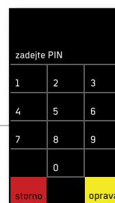
verze řízení přístupu